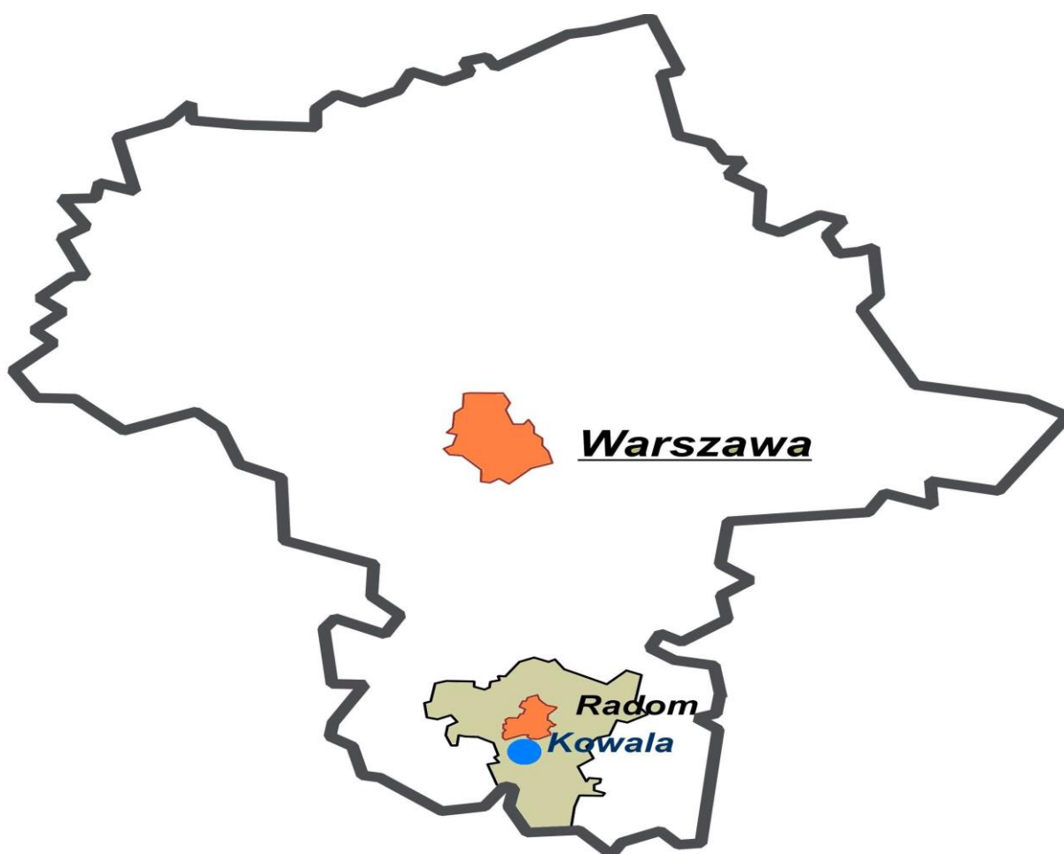
Powiat radomski i gmina Kowala na tle województwa mazowieckiego.

Kowala należy do mniejszych gmin powiatu radomskiego, natomiast pod względem liczby mieszkańców wynoszącej obecnie 11999 osób lokuje się nieco powyżej średniej dla całego regionu.