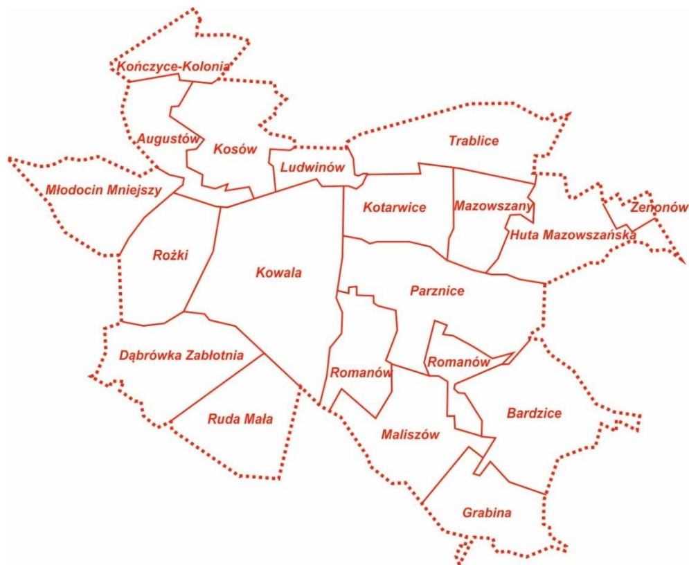
Podział Gminy Kowala na sołectwa.

Augustów, Bardzice, Dąbrówka Zabłotnia, Grabina, Huta Mazowskańska, Kończyce – Kolonia, Kosów, Kotarwice, Kowala, Ludwinów, Maliszów, Mazowszany, Młodocin Mniejszy, Parznice, Romanów, Rożki, Ruda Mała, Trabllice, Zenonów.