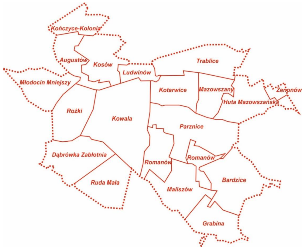
Podział Gminy Kowala na sołectwa.

Augustów, Bardzice, Dąbrówka Zabłotnia, Grabina, Huta Mazowskańska, Kończyce – Kolonia, Kosów, Kotarwice, Kowala-Stępcina, Ludwinów, Maliszów, Mazowszany, Młodocin Mniejszy, Parznice, Romanów, Rożki, Ruda Mała, Trabllice, Zenonów.